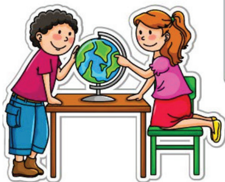
Picture 1. Student feedback methodology

cess. A number of methods and technologies are now being used to further enrich the classroom process, improve the quality of education, and motivate students to engage in a particular subject and subject, using these techniques to help students think independently through the thought storm. teach. Method Objective: Students will be able to reason and defend their views on a particular problem. Provide the student with the opportunity to change their mind during the discussion. The teacher can bring all the students into the discussion and create a debate between all the students in the classroom.