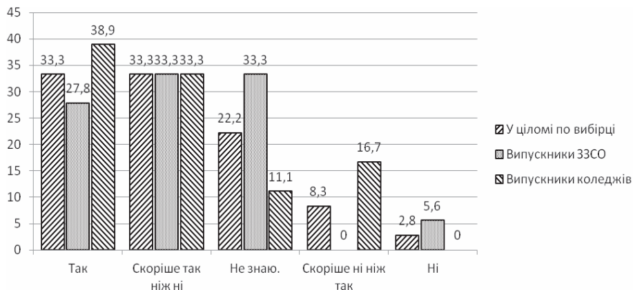
Мал. 1. Достатність інформації для обґрунтованого вибору професії вступниками.

Як свідчить таблиця, всі категорії респондентів віддають перевагу офіційним сайтам закладів професійної освіти, де розміщується вичерпна інформація про освіт-